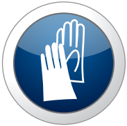
Gants en Nitrile