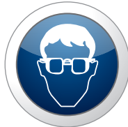
Lunettes de sécurité